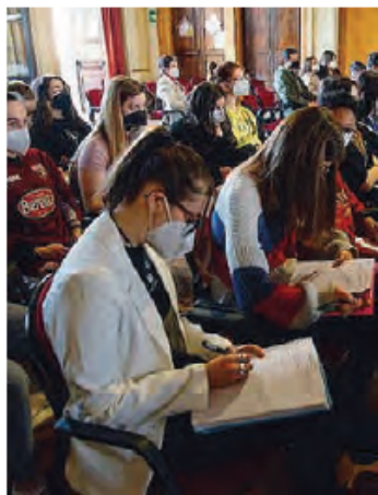
Studenti. Durante la conferenza