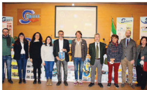
Orientamento. I professionisti rotariani intervenuti all'incontro