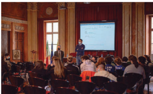
Grafica e Comunicazione. Coinvolti gli studenti delle classi quarte